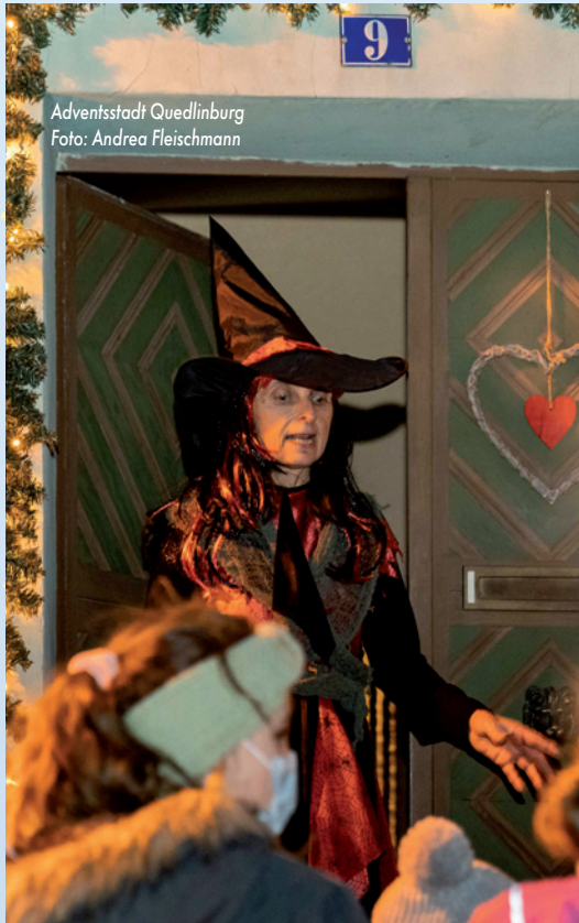
Adventsstadt Quedlinburg