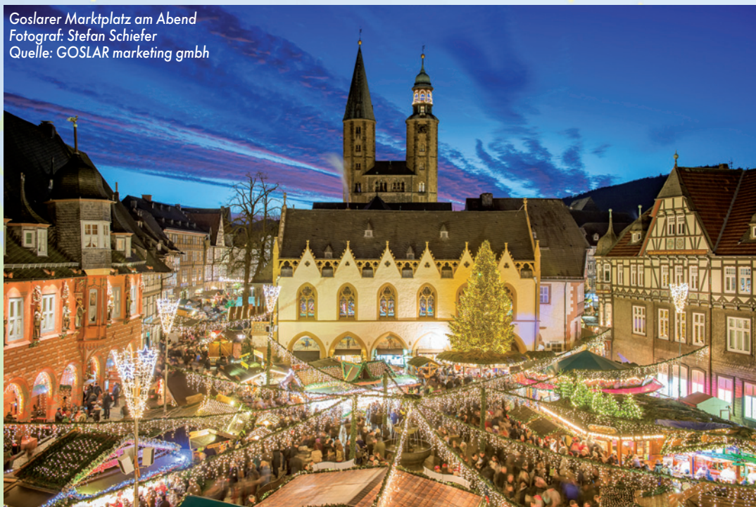
Goslarer Marktplatz am Abend

Eine Auswahl gemeldeter bzw. ermittelter Veranstaltungen. Alle Angaben ohne Gewähr.