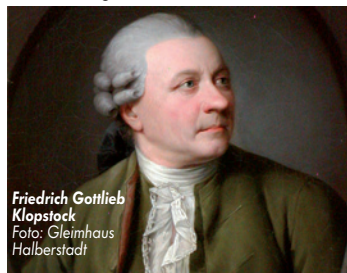
Friedrich Gottlieb Klopstock

bis 03.11. Hexoween-Markt, Thale 02.11., 15 Uhr Schablonentechnik nach T. Lux Feininger, Museum Lyonel Feininger Quedlinburg 03.11., 20 Uhr Kabarett Thomas Nicolai „Kamisi - Irren ist männlich“, DV Reichenstrasse Quedlinburg 06.11., 15 - 17 Uhr Offene Druckwerkstatt Hoch- und Tiefdruck, Museum Lyonel Feininger Quedlinburg 08.11., 18 Uhr Autorenlesung Angela Steidele „Aufklärung!“, Klopstockhaus Quedlinburg