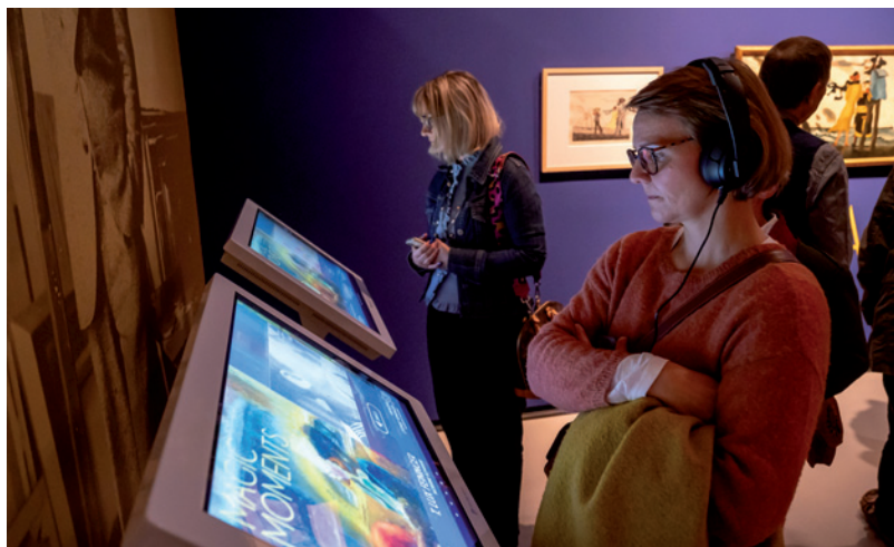
Ausstellungsimpressionen: T. Lux Feininger | Magic Moments