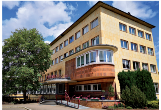
Das im Stile des Bauhaus errichtete Diakonissen-Mutterhaus in Elbingerode

Gastronomie: Im Rahmen einer Führung oder Besichtigung können Mahlzeiten (z.B. Mittagessen oder Kaffee und Kuchen) für eine Tagesgruppe dazu bestellt werden. Mahlzeiten, die während eines Aufenthaltes in unserem Gästehaus Tanne gewünscht sind, werden über die Rezeption bestellt. Für besondere Anlässe wird auch ein festliches