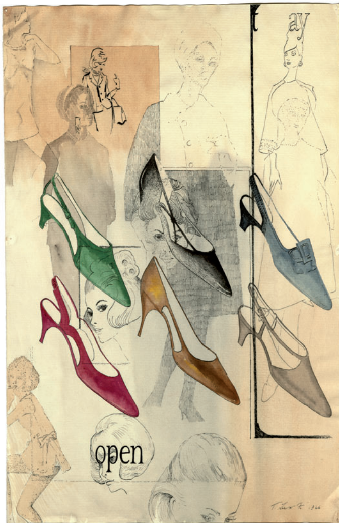
T. Lux Feininger, Damenschuhe offen , 1966, Stiftung Bauhaus Dessau, Estate of T. Lux Feininger