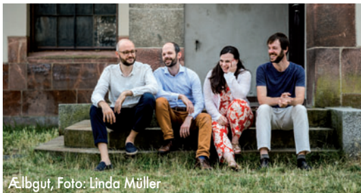
Ælbgut