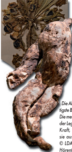
Die Alraune war der magisch wichtigste Bestandteil von Hexensalben. Die menschengestaltige Wurzel hat der Legende nach solche magische Kraft, dass jedes Geschöpf, das sie ausreißt, das Leben verliert.

Magie ist in der Kulturgeschichte nahezu allgegenwärtig. Noch bis zum 13. Oktober beleuchten außergewöhnliche Objekte aus 45 nationalen und internationalen Sammlungen dieses vielschichtige Thema: Von ersten Hinweisen in der Vorgeschichte, über Ausprägungen magischen Denkens in Antike, Mittelalter und