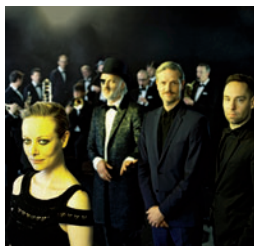
Die Big Band aus „Babylon Berlin“