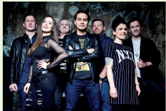
Partyband Right Now