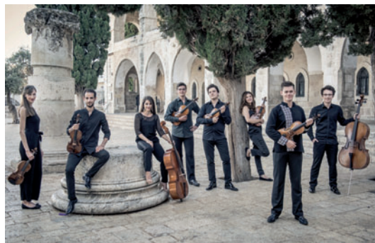
Oberton String Octet

Freuen Sie sich auf das vielseitige Festival mit internationaler