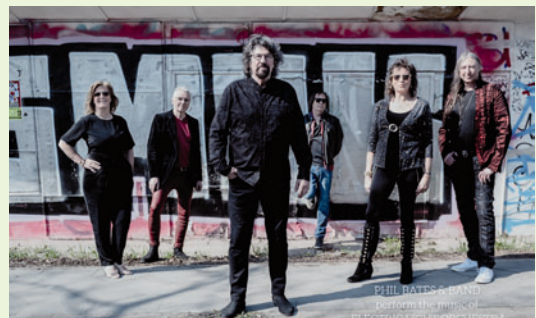
Phil Bates & Band - Electric Light Orchestra