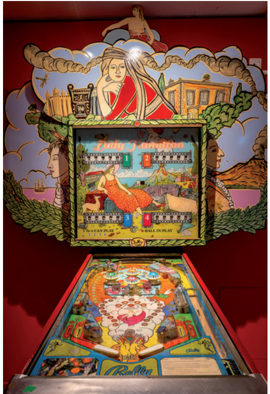
„Lady Hamilton“ Flipper Automat, Moritz Götz, Foto: Ray Behringer ©Kulturstiftung Sachsen-Anhalt

Museum Lyonel Feininger Welterbestadt Quedlinburg Schlossberg 11 06484 Quedlinburg T: +49 3946 68 95 938 20 F: +49 3946 68 95 938 24 www.museum-feininger.de museum-feininger@kulturstiftung-st.de