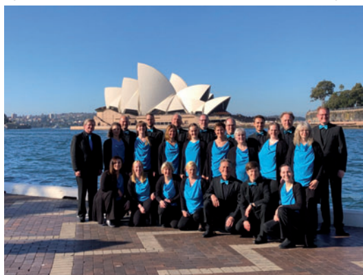
Junge Vokalensemble Hannover