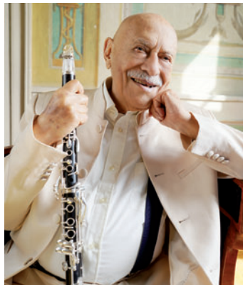
Giora Feidman