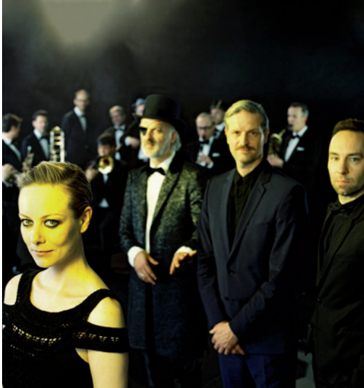
Die original Big Band aus „Babylon Berlin“ mit den Songs der Serie Live in Concert!

An drei Tagen können sich Jazzfans auf fulminante Konzerte und Aufführungen inmitten einer bezaubernden Kulisse gefasst machen. Bei diesem Jazz-Festival bekommen Sie einzigartige Einblicke in ein facettenreiches Genre. Selten wird eine Musikrichtung so eindrücklich für das Publikum erlebbar gemacht.