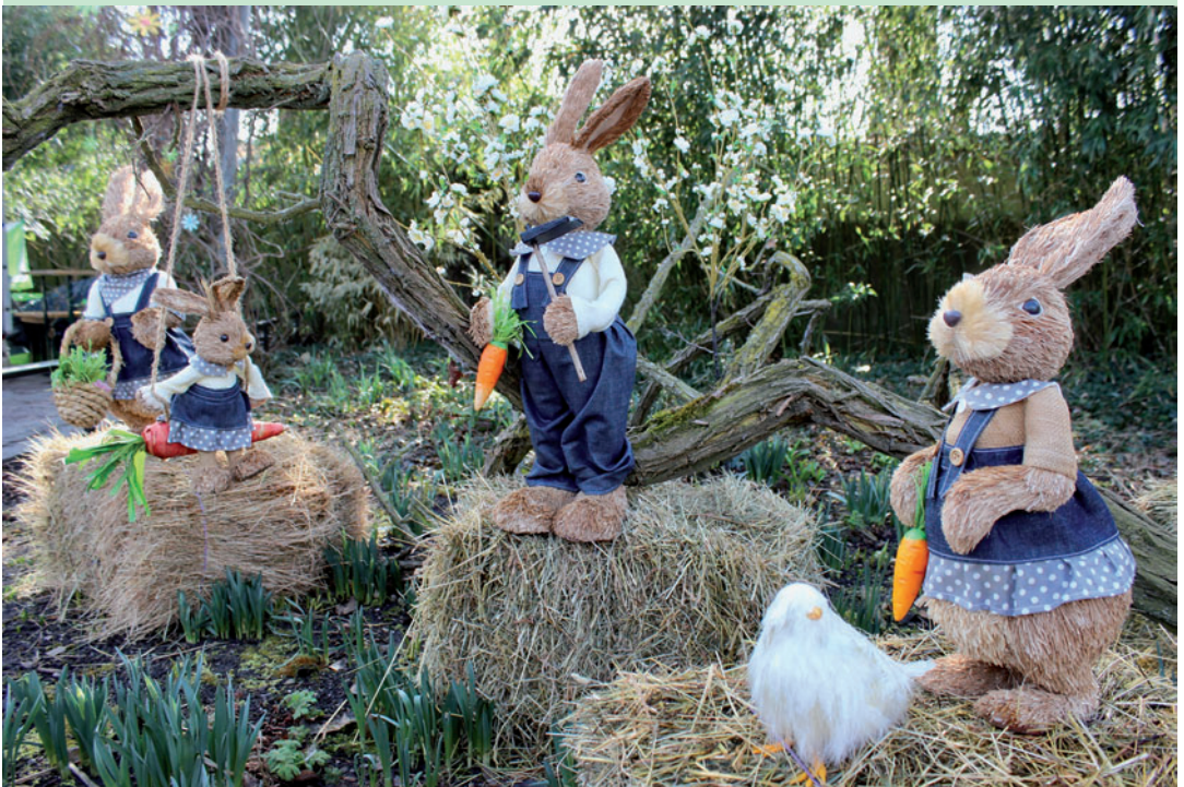
Die Fantastische Osterwelt im Zoo Halle