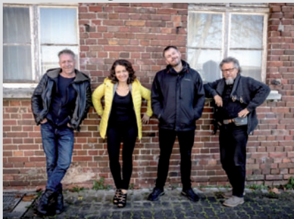
Old Shoes and Smelly Socks spielen das Abschlusskonzert der 59. Zerbster Kulturfesttage.

Ausstellungen, Konzerte, Lesungen, Vorträge, Mitmach-Angebote und vieles mehr erwartet die Besucherinnen und Besucher der 59. Zerbster Kulturfesttage. Die traditionsreichen Kulturwochen werden erstmals von 4 auf 5 Wochen verlängert und finden vom 16. Februar bis zum 24. März 2024 statt.