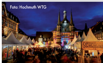
Wernigerodes Altstadt verwandelt sich zur chocolART in eine Schoko-Erlebniswelt. Auf dem Marktplatz vor dem historischen Rathaus präsentieren Top-Chocolatiers aus unterschiedlichen Ländern ihre erlesenen Produkte und laden ein, bei Pralinenkursen, heißer Schokolade und Kakao-Malerei die Vielfalt der Schokolade zu entdecken. Zahlreiche Restaurants und Cafés bieten während der chocolART Schokoladenmenüs an. Öffnungszeiten: 27. + 28.10., 10 - 19 Uhr 29. - 31.10., 10 - 18 Uhr Der Eintritt ist kostenfrei Weitere Informationen auf www.chocolART-wernigerode.de

27. - 31. Oktober, ab 10 Uhr Schokoladenfestival „chocolART“ , Innenstadt Wernigerode