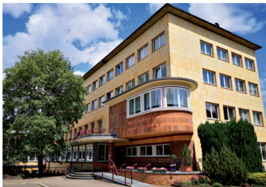
Das im Stile des Bauhaus errichtete Diakonissen-Mutterhaus in Elbingerode

Im Rahmen einer Führung oder Besichtigung können Mahlzeiten (z.B. Mittagessen oder Kaffee und Kuchen) für eine Tagesgruppe dazu bestellt werden. Mahlzeiten, die während eines Aufenthaltes in unserem Gästehaus Tanne gewünscht sind, werden über die Rezeption bestellt. Für besondere