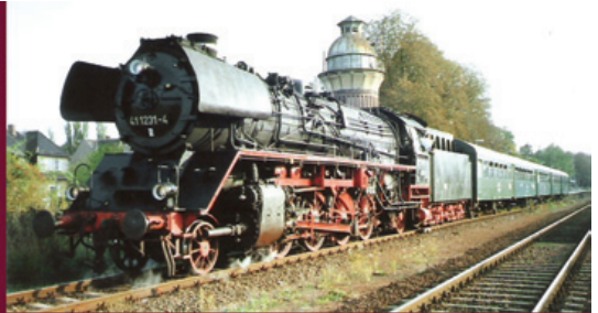
Impressionen von den Sonderfahrten der Eisenbahnfreunde Lokschuppen Staßfurt