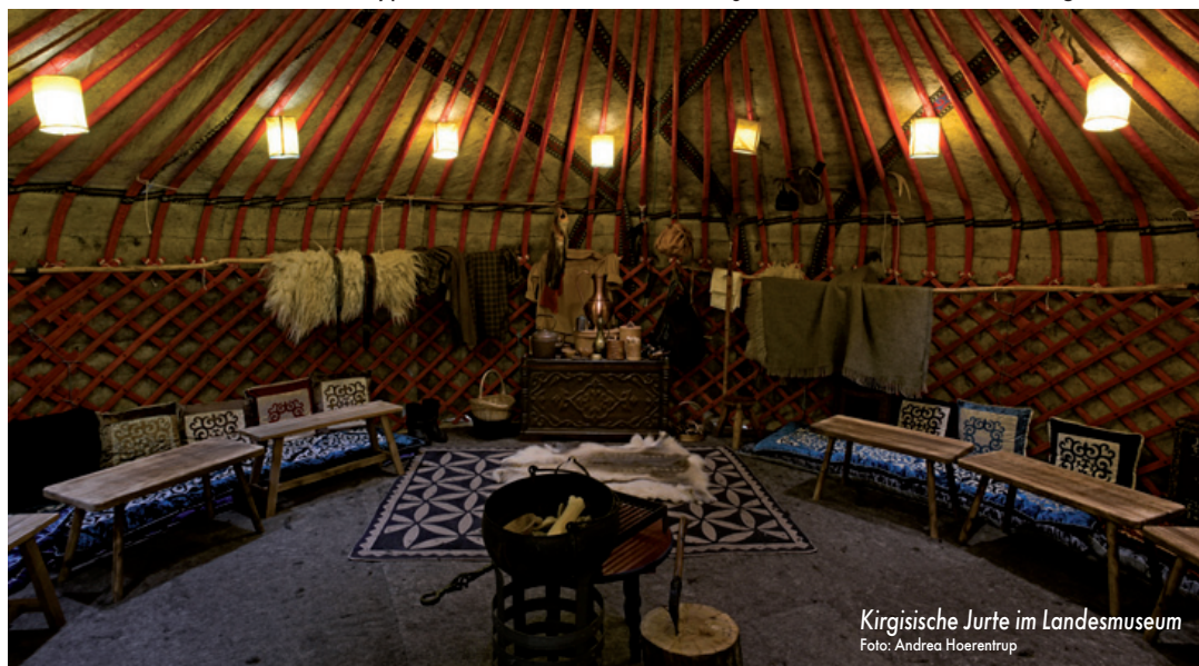
Kirgisische Jurte im Landesmuseum

Das vollständige Programm und die genauen Termine finden Sie unter www.landmuseum-vorgeschichte.de/veranstaltungen.html