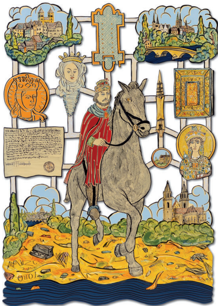
Kunstwerk Moritz Götze: Otto I.

Ab 19.30 Uhr lädt die Stiftskirche St. Servatii zu einer musikalischen Sonderführung im Kerzenschein ein: Meistens kennt man Kirchen nur bei Tageslicht. Zur Nachtzeit